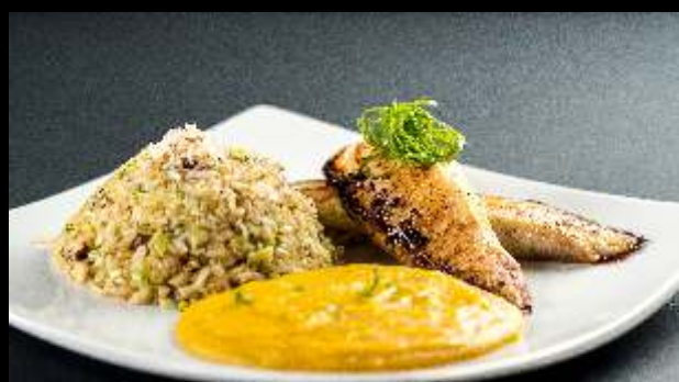
Filé de Tilápia c/ Purê de Cenoura