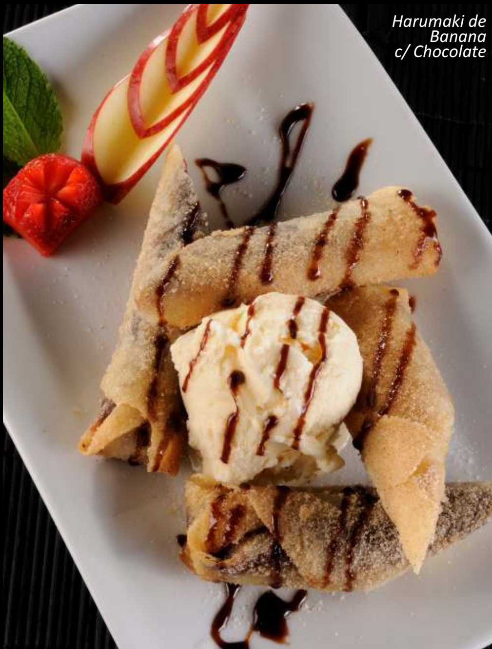
Harumaki de Banana c/ Chocolate