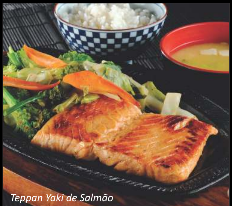
Teppan Yaki de Salmão