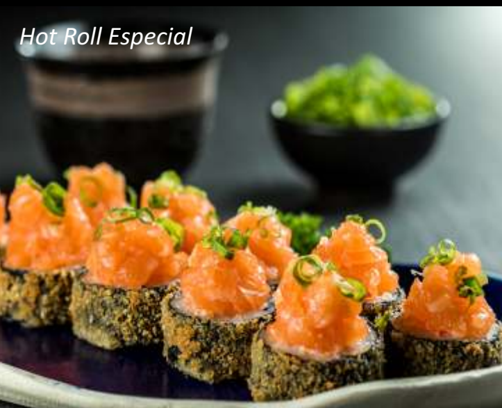
Hot Roll Especial