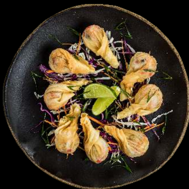
Trouxinhas de Salmão