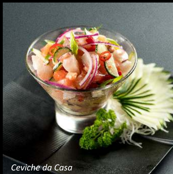
Ceviche da Casa