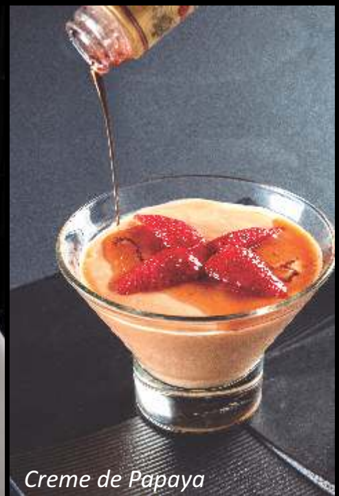
Creme de Papaya