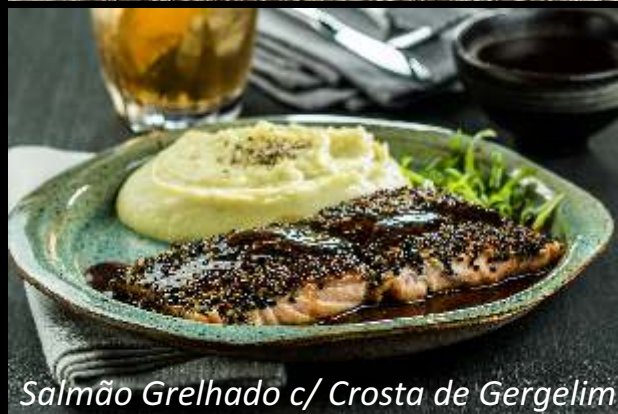
Salmão Grelhado c/ Crosta de Gergelim