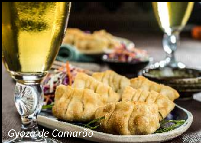
Gyoza de Camarão