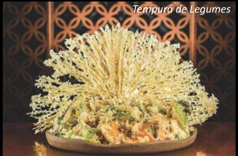
Tempurá de Legumes