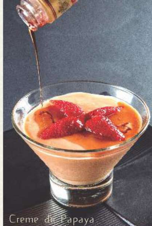
Creme de Papaya